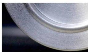
「Flerute(フレルテ)」動画のキャプチャ画面